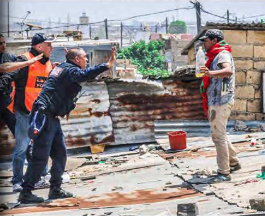
أحد سكان الحي الصفيحي كاريان سونطرال بالدار البيضاء يحاول حرق نفسه أمام السلطات

وإن تحدثنا عن هذا الصد الثقافي المحيط بالعشوائيات، والذي يحول دون حصولهم على المعرفة، بدأ من بُعد المدارس عن دور الصفيح، بل وحتى البعد النفسي، حيث يجد أبناء دور الصفيح، صعوبة في التأقلم مع باقي الأطفال، في حين تقطع الفتيات والنساء عن الدراسة، إذ لا تتاح لهن فرصة التعليم، لتحمّلن عبء نقل المياه لمسافات طويلة، بالإضافة إلى رعاية