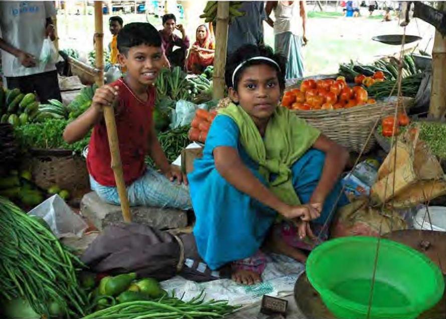
أبناء أحد العشوائيات ببغداد يعملون في بيع الخضار

غير المهيكل بهدف سد حاجياتهم اليومية، مما يزيد من حدة هذا القطاع، وما له من تداعيات على اقتصاد الدولة. ونتيجة للبطالة والفقر، نجد أن عدداً من الأطفال أبناء العشوائيات يلجؤون إلى العمل في سن صغيرة، دون حتى تلقي أي تدريب، فقط من أجل إعالة عائلتهم، فتجدهم يعملون في ظروف قاسية، في بعض الأحيان حتى في بيع الممنوعات، في حين تعمل الفتيات كخادمات بيوت، والمشاكل التي قد تنتج عن هذا، من تحرش واستغلال.