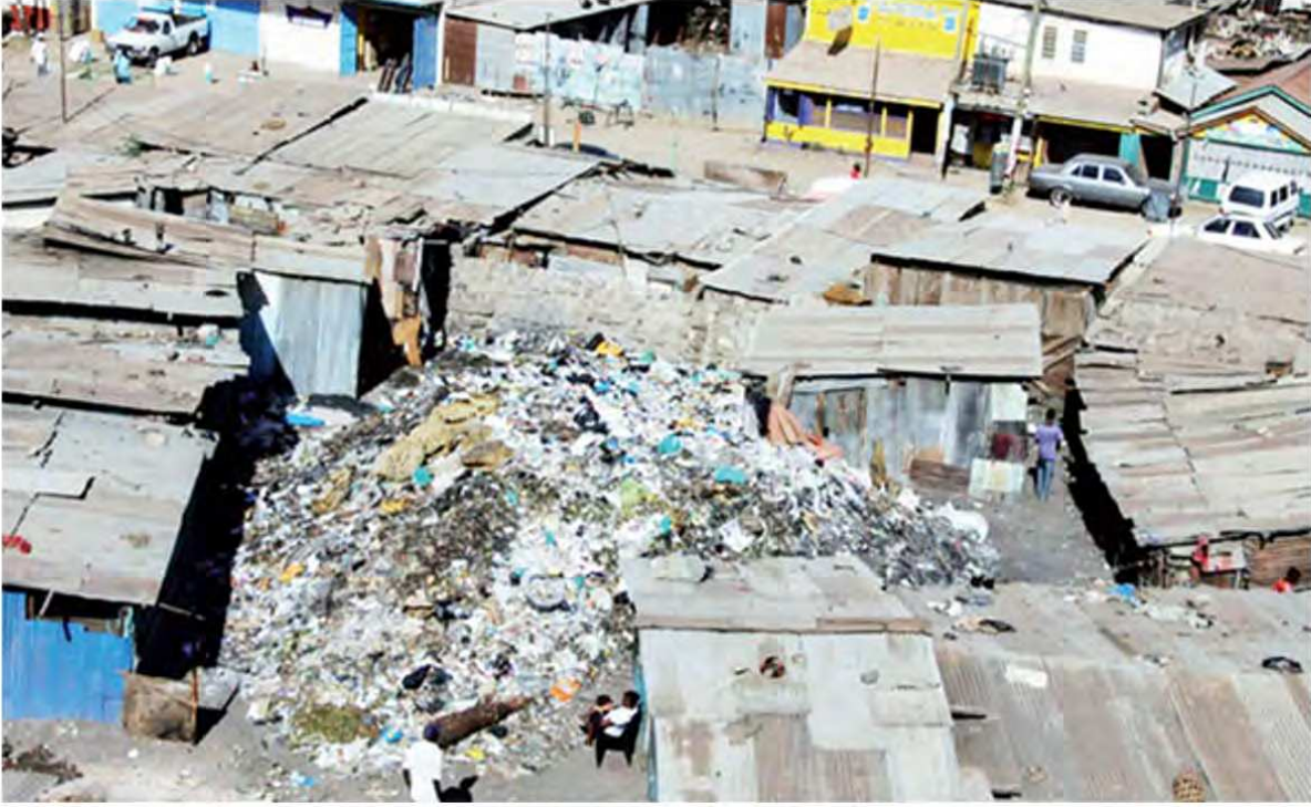
تكدس الأزبال بأحد العشوائيات الشعبية بمدينة الدار البيضاء.

يعود ذلك بالأساس إلى نقص في الترتيبات الأساسية التي ترتبط بالوسط الحضري، والتي تغيب في العشوائيات الشعبية، مثل إمدادات المياه والكهرباء، حتى المراحيض المشتركة التي