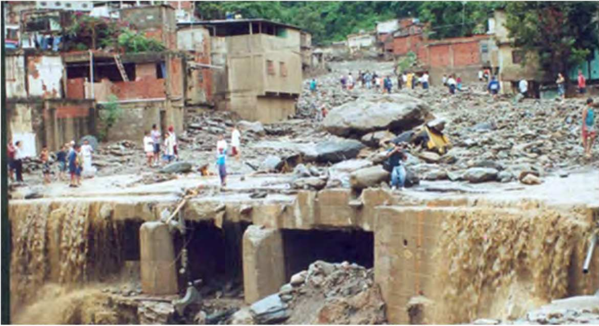
أحداث فنزويلا 1999

في منتصف تشرين أول 1999، هزت عاصفة شمال فنزويلا، حيث ثلثا المساكن من العشوائيات، سقطت أمطار طوال السنة، إذ قدر بأن هطول الأمطار في بعض المناطق هو الأكثر غزارة في الألفية.