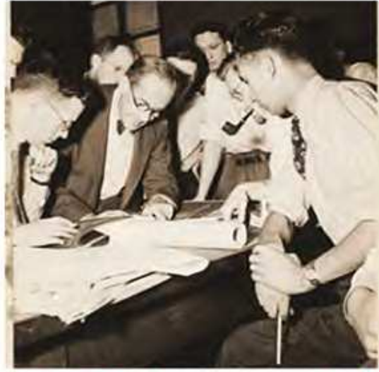
والتر غروبيوس مع بعض طلاب جامعة هارفرد

قسم العمارة بهارفرد هو بمثابة مجتمع فريد من نوعه، غني في تنوعه وتعاونه ومنحه الجامعية، حيث يجد الطلاب أنفسهم في خضم أكثر المناهج التعليمية إبداعاً، مع هيئة تدريس بارزة في هذا المجال.