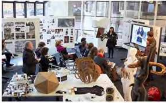
أحد فراغات قسم العمارة