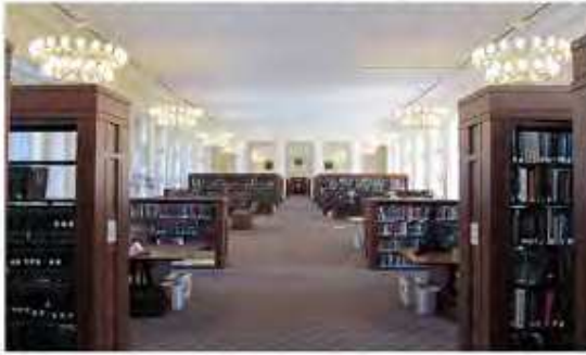
غرفة القراءة في إحدى مكتبات الجامعة (قاعة لانجديل)، في مدينة كامبريدج، ماساتشوستس

الجدير بالذكر أن الجامعة تمتلك أكبر مكتبة أكاديمية في الولايات المتحدة والعالم، تبلغ محتوياتها 19 مليون كتاب و 400 مليون مخطوطة، و 10 ملايين صورة بالإضافة إلى المصادر المعرفية المتنوعة، فالكلية تتمتع الطالب بحياة جامعية جيدة، ابتداء من الحرم الجامعي الذي يحتل مساحة 85 هكتارا، حتى المنح الدراسية المخصصة للطلاب الذين لا يستطيعون سداد القروض من شتى أنحاء العالم. وقد حصلت الجامعة عام 2014 على أكبر منحة في تاريخها قدمتها مؤسسة "مورنينغ سايد" لكلية الصحة العامة في الجامعة بقيمة 350 مليون دولار تم تخصيصها للطلاب المحتاجين.