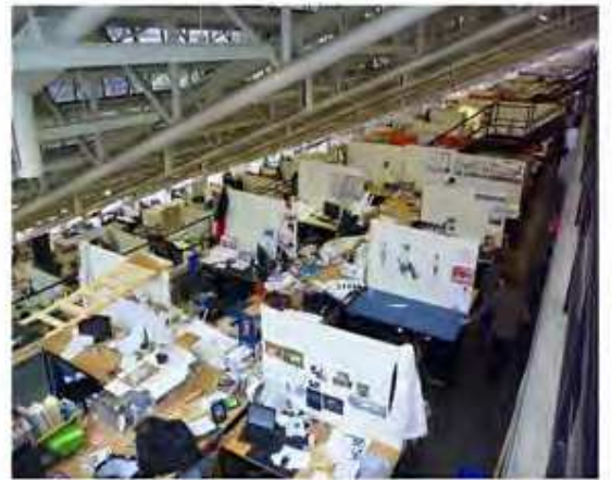
Gund Hall ومساحات العمل المفتوحة