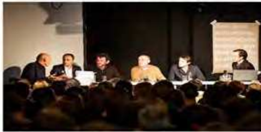
ريم كولاس وأنطوان بيكون وأساتذة آخرين

وسنجد أن الجسم التعليمي لكلية هارفرد للعمارة يتكون من معماريين قد وصلوا للعالمية بتصاميمهم، وحتى أن بعضهم حصلوا على جائزة البريتزكر، مثل ريم كولاس، وكلاً من هيرتسوغ و دي مورون، و رافاييل مونيو، أنطوان بيكون، كما تشهد الكلية العديد من المحاضرات يلقيها مهندسون وباحثون من شتى أقطار العالم.