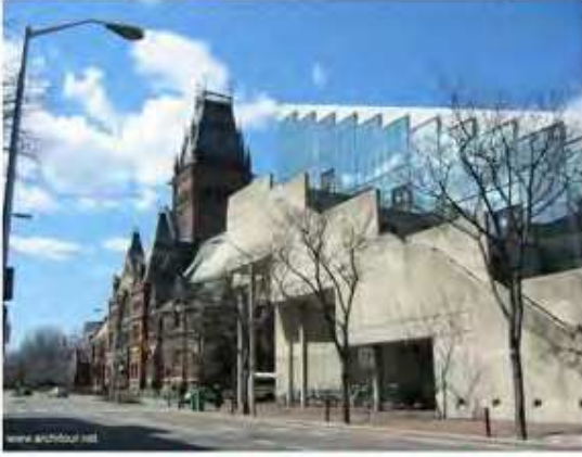
مبنى كلية العمارة في جامعة هارفرد

ومن خلال زيارة الباحثين ونقاد التصميم من شتى بقاع العالم، يستكشف الطلاب مجموعة من التصاميم والأفكار التي تغني حقلهم المعرفي، كما يعملون على مواجهة التحديات البيئية الحالية، من خلال البحث واستكشاف الحلول، والطاقت الجديدة. ويحتدم التعاون في قاعة GundHall- وطاولاتها المميزة من خلال خمسة طوابق من مساحات العمل المفتوحة.