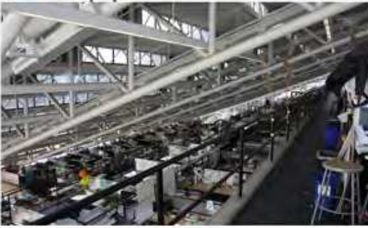
Gund Hall ومساحات العمل على 5 طوابق