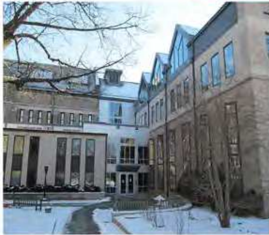
مكتبة هارفارد اللاهوتية

هذا بالإضافة إلى المختبرات التابعة للقسم والتي تعمل على دمج المعرفة النظرية بالتطبيقية من خلال البحث، إضافة إلى إرادة قوية لتمكين التصميم وجعله وسيطاً للتغيير في المجتمع.